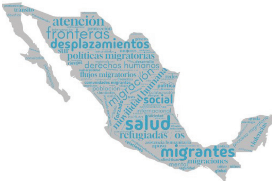
Imagen 1. Nube de palabras claves actividades en la frontera